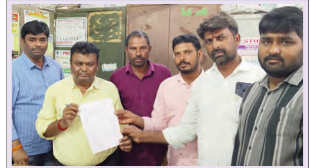
వినతిపత్రం అందజేస్తున్న వార్డు సభ్యులు, గ్రామస్థులు