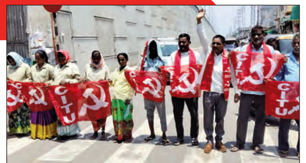
రాస్ట్రోకో చేస్తున్న గ్రామపంచాయతీ కార్మికులు, నాయకులు