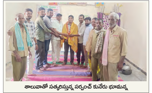
శాలువాతో సత్కరిస్తున్న సర్పంచ్ కునేరు భూమన్